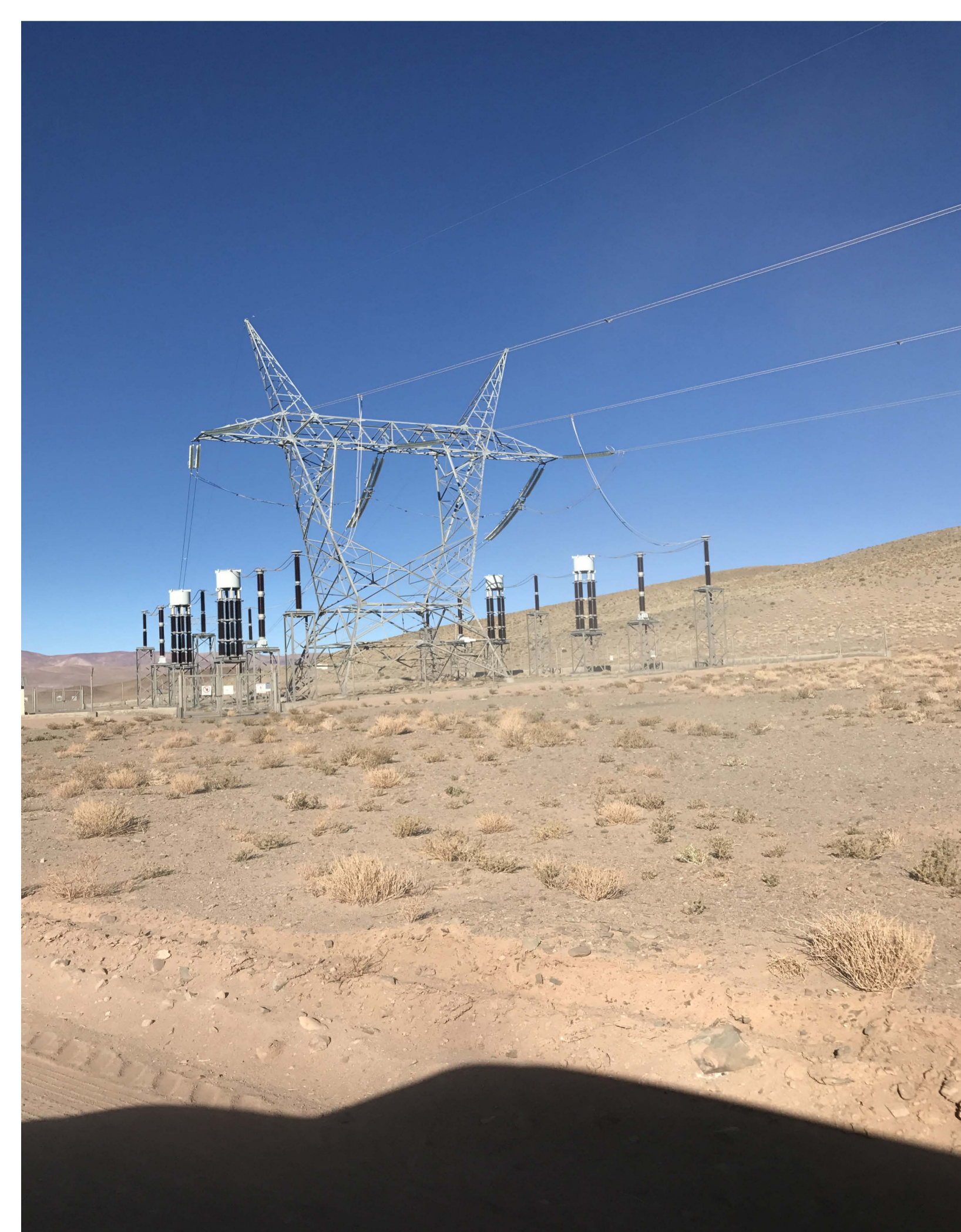
exzellente Infrastruktur nahe Pastos Grandes